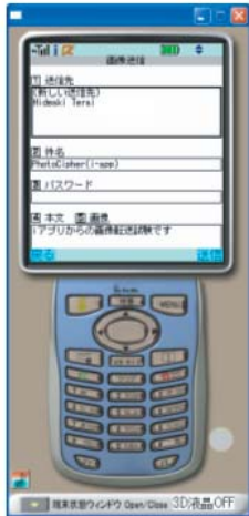
◀ 画像送信時の画面例